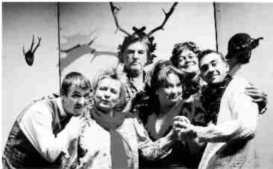
Z představení „Lovu zdar“

Předprodej na připravovanou divadelní představení zahajujeme již 1.12.2005